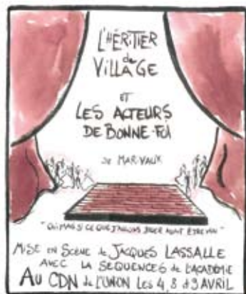
dessins : Mathilde Monjanel